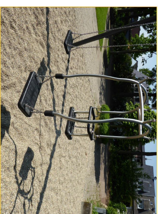
Schaukelsitz Groß und Klein