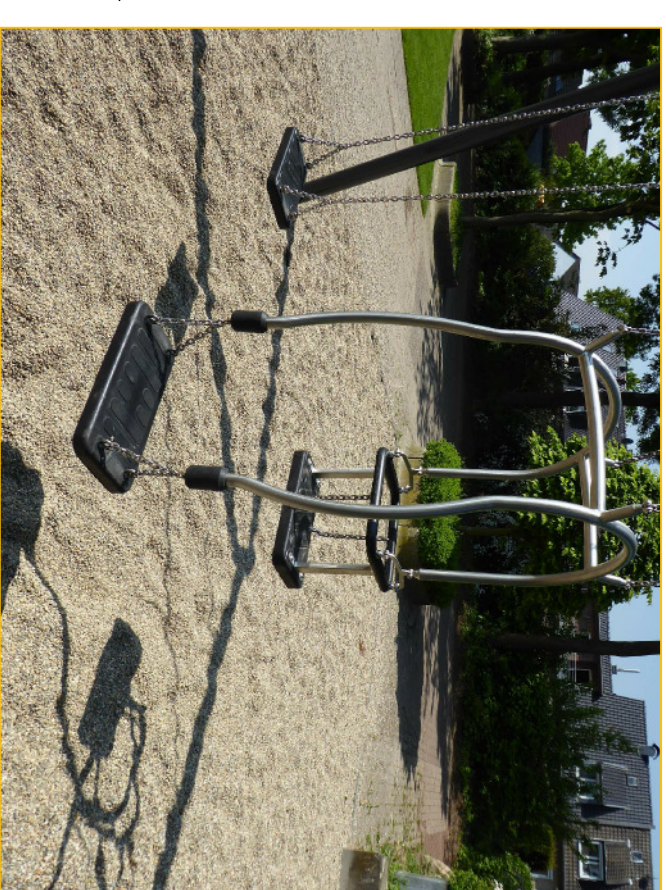
Schaukelstz Groß und Klein