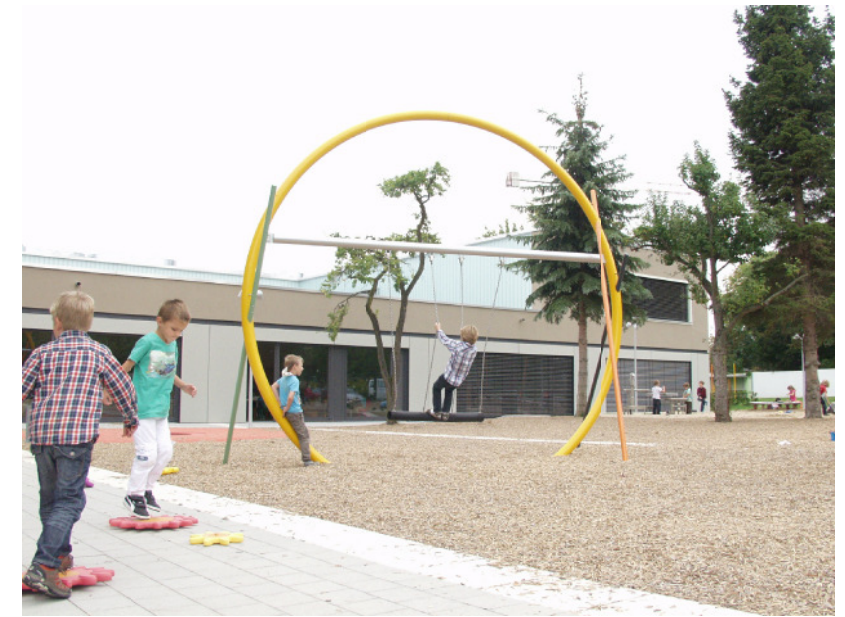
Rohrbogen und Mikadostangen