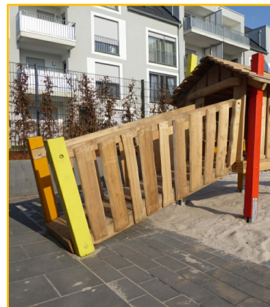
schräge Rampe mit Brüstung