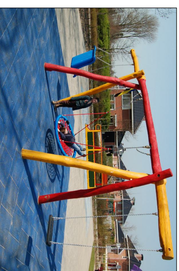
02 2869 Kombischaukel (Ausführung lasiert)