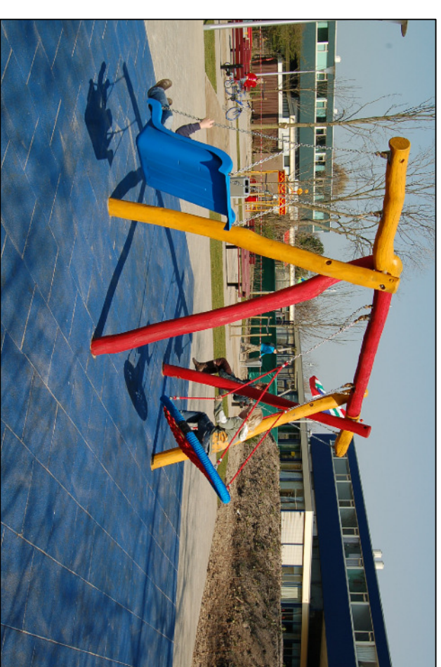
02 2869 Kombischaukel (Ausführung lasiert)