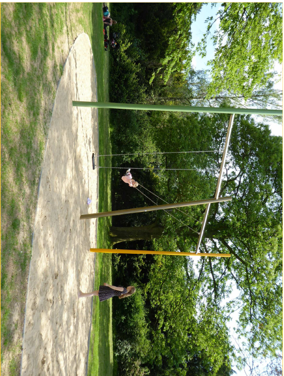
Doppeltor-Stahlschaukel mit Sicherheits-Schaukelsitzen