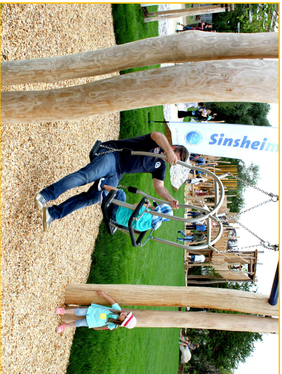
Schaukelsitz Groß und Klein