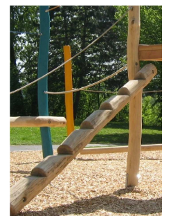
Steigstamm mit Handlaufseil