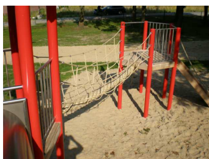
Netzbrücke mit Tampen