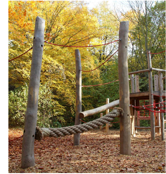
Balanciertampfen mit Hangelseil