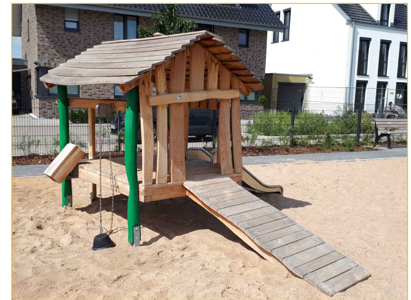
Ausführungsbeispiel mit Robinienpfosten